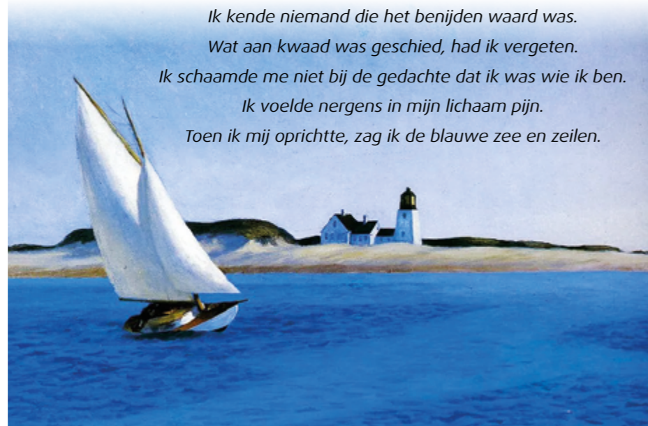
The Long Leg, Edward Hopper, 1935

Toen ik mij oprichtte, zag ik de blauwe zee en zeilen.