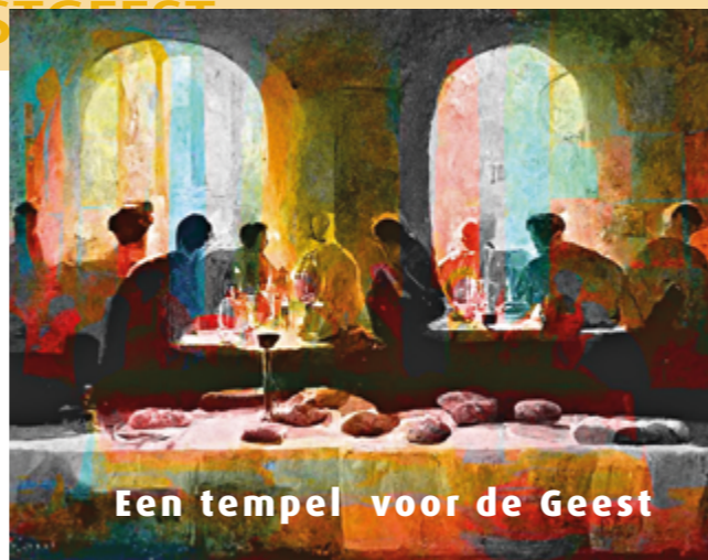
Een tempel voor de Geest