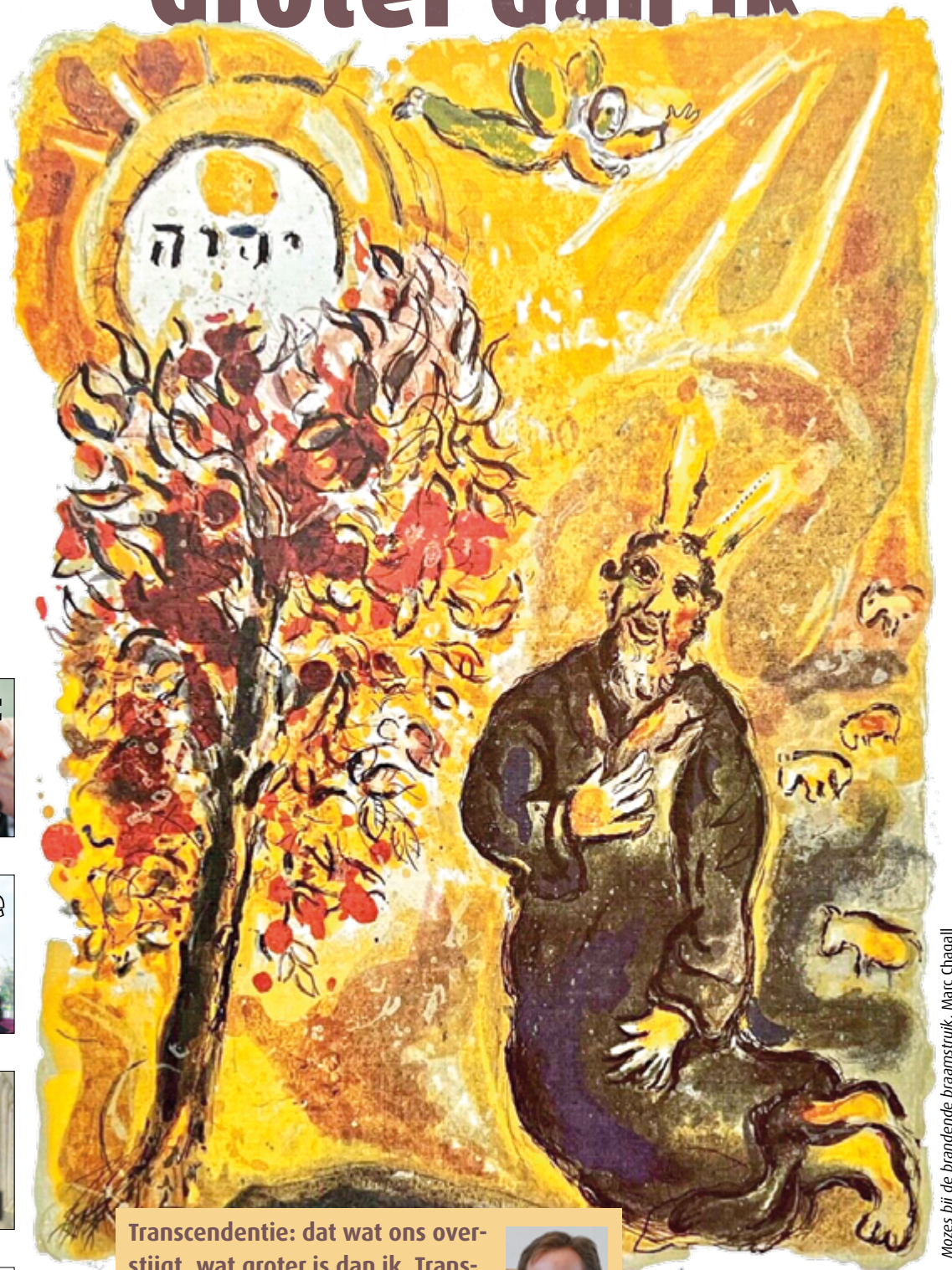
Mozes bij de brandende braamstruik, Marc Chagall