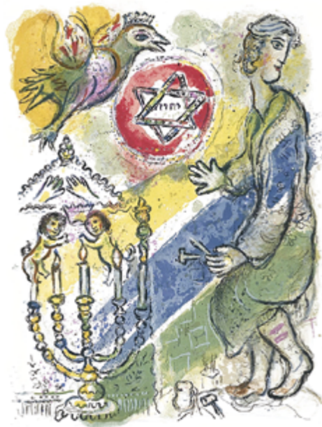
Besaleël, 1966, kleurenlithografie uit de serie 'Het verhaal van de uittocht', Marc Chagall (1887-1985), 53 x 40 cm.

Wanneer ik zing ter ere van God, voel ik Hem. Niet altijd. Soms wanneer we oefenden met de band in de kerk, raakten woorden of noten mijn ziel en voelde je Zijn aanwezigheid.