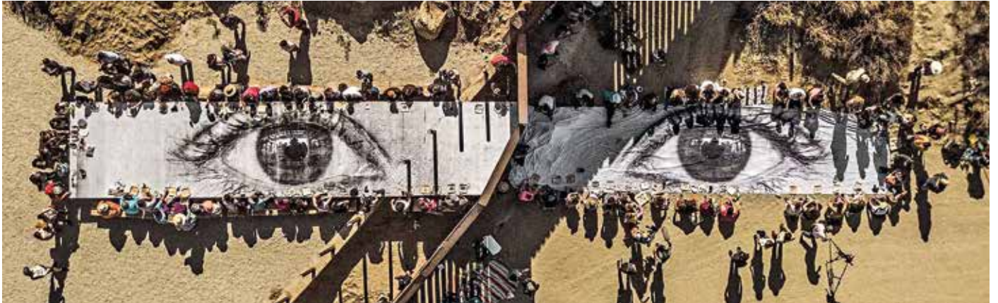
Migranten, Picknick over de grens, Tecate, Mexico-U.S.A., © JR, 2017

Een tafel aan beide kanten van de muur. Links zitten mensen aan tafel in de VS en rechts mensen op de grond in Mexico. Het is een fascinerend plaatje waar je van alles bij kunt denken en vragen. Waar zou jij zitten? Op wie lijkt jij het meest? Misschien ben je links, misschien aan de rechterkant geboren. Ga er in je verbeelding maar gewoon zitten.