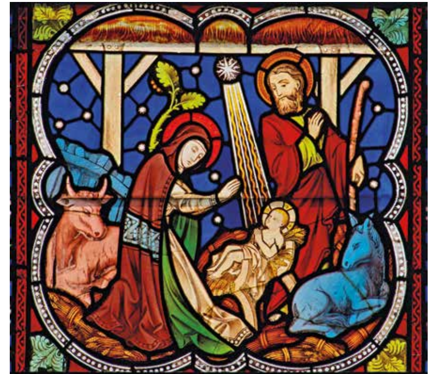
Iers glas-in-lood, kunstenaar onbekend

"Wil je stoppen bij nummer dertien?" vraagt de jongen. Hij rent naar binnen. Even later komt hij terug. Hij draagt zijn