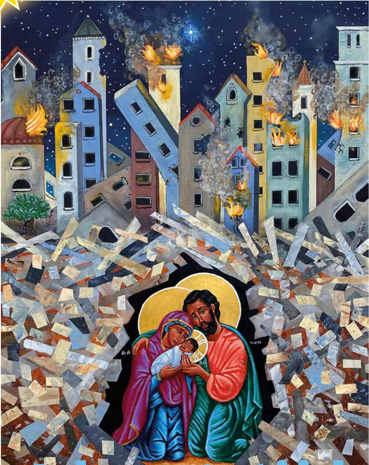
Christus in puin, Kelly Latimore Icons