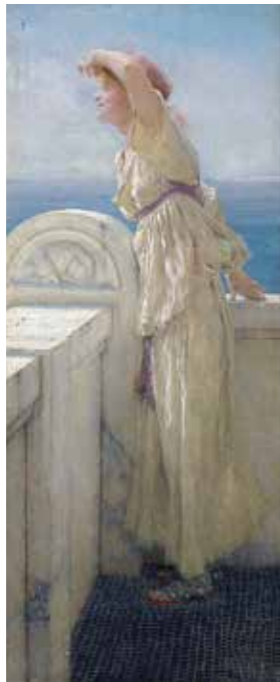
Hopeful (1909) Sir Lawrence Alma-Tadema

Het niet meer weten, terwijl ik altijd ergens nog een sprankje hoop had, licht aan de horizon zag gloren, dat was een nieuwe voor mij. In dit soort situaties heb ik behoefte aan wijsheid. Wat is wijs in dit geval? Wijsheid als honing voor je leven. Dat proef ik zeker. Het is in ingewikkelde situaties fijn om te sparren, zeker met mensen die je hoog acht. Die kennis of levenswijsheid in huis hebben. Die durven vanuit andere perspectieven te kijken, die out-of-the-box denken, kri-